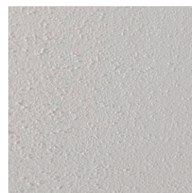
Vysoký stupeň bělosti, výborný výsledek.