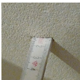
maximálně přídržná (až do 12 mm v jedné vrstvě)