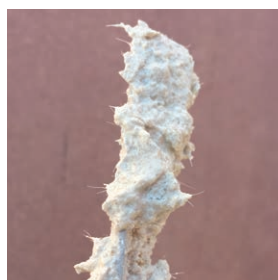
Integrovaná výztuž s vlákny pro minimální riziko trhlin