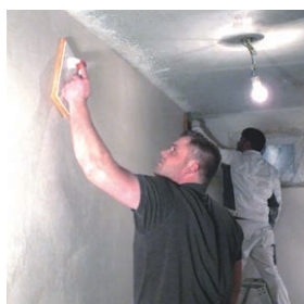
optimalizovaná pro přefilcování